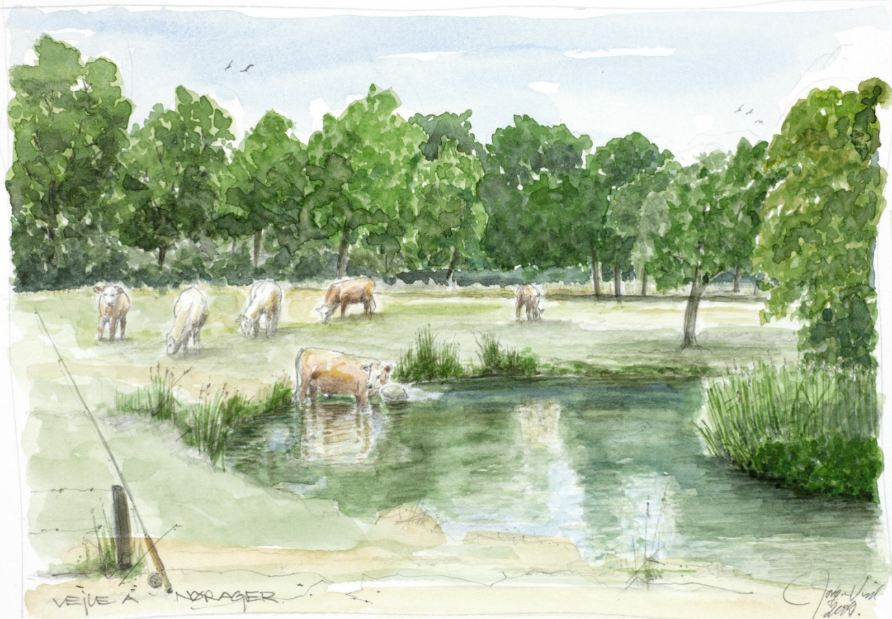
Akvarel: Jørgen Vind, 2010